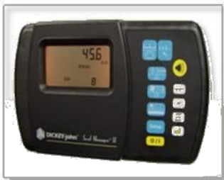
Монитор контроля параметров высева Dickey-john