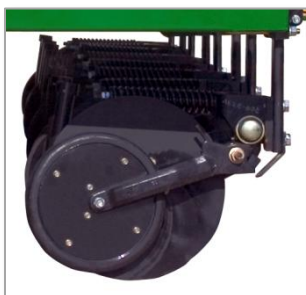
Приспособление для внесения сухих удобрений