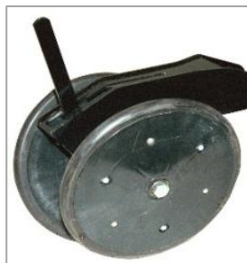
V-образные катки с регулируемым усилием прикатывания семян