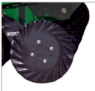
Турбо-дисковые ножи на раме сошника или раме сеялки