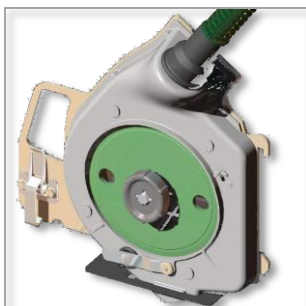
Дисковый высевающий аппарат для высева семян сои, сорго или хлопка