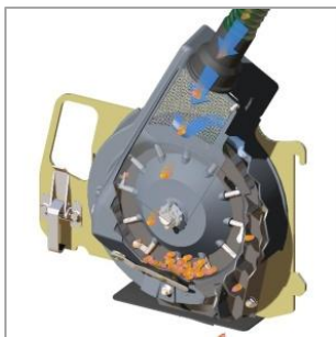
Высевающий аппарат для высева семян подсолнечника и кукурузы